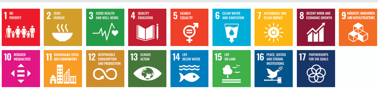
მხარს ვუჭერთ მდგრადი განვითარების მიზნებს

"მიუხედავად საყოველთაოდ აღიარებული ფაქტისა, რომ შემოქმედებითი ეკონომიკა ხელს უწყობს გლობალურ კეთილდღეობას, აღნიშნავს კულტურულ გამორჩეულობას და მხარს უჭერს სოციალურ ერთობლიობას, როცა საქმე პოლიტიკის მოქმედებას ეხება, ის მაინც განიხილება, როგორც განცალკევებული. აღნიშნული თერთმეტი სამოქმედო პუნქტიდან უმეტესმა მათგანმა შეიძინა ღირებულება მსოფლიოს სხვადასხვა ნაწილში, განსაკუთრებით წარმოსახვითი და შთაგონების უნარის მქონე ადგილობრივ და მუნიციპალურ ლიდერებს შორის, თუმცა, ხშირად არ ხდება მათი გამოყენება. ჩვენი გზავნილი არის, რომ თუ ჩვენ გვინდა მივალწიოთ სასწრაფო რეკონფიგურაციას, რომელიც მსოფლიოს სჭირდება, ეს იდეები უნდა იქცეს საჭარო პოლიტიკის მთავარ ნაწილად ადგილობრივ, ეროვნულ და საერთაშორისო დონეზე."